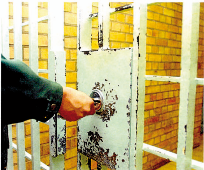
Wer seine Strafe in der Justizvollzugsanstalt in der Holzstraße verbüßt, kann auf die Unterstützung durch den Verein bauen.

In den ersten Jahren ein reiner Gefängnisverein, wurde die Straffälligenhilfe – damals noch „Verein für Gefangenenfürsorge im Landgerichtsbezirk Wiesbaden“ genannt – bereits kurz nach dem Zweiten Weltkrieg wiederbelebt und hat seitdem einen wichtigen Beitrag zur Resozialisierung jugendlicher Straftäter geleistet.